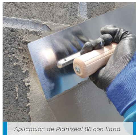
Aplicación de Planiseal 88 con llana