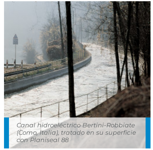
Canal hidroeléctrico Bertini-Robbiate (Como, Italia), tratado en su superficie con Planiseal 88